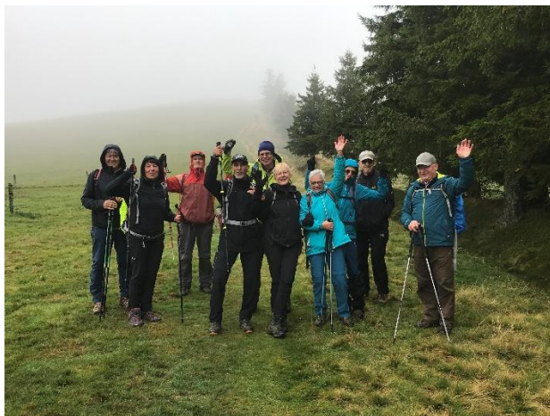
Vogesen-Wanderwoche im Sept. 2025, am Petit Ballon

PC-Store und IT-Systemhaus unter einem Dach.